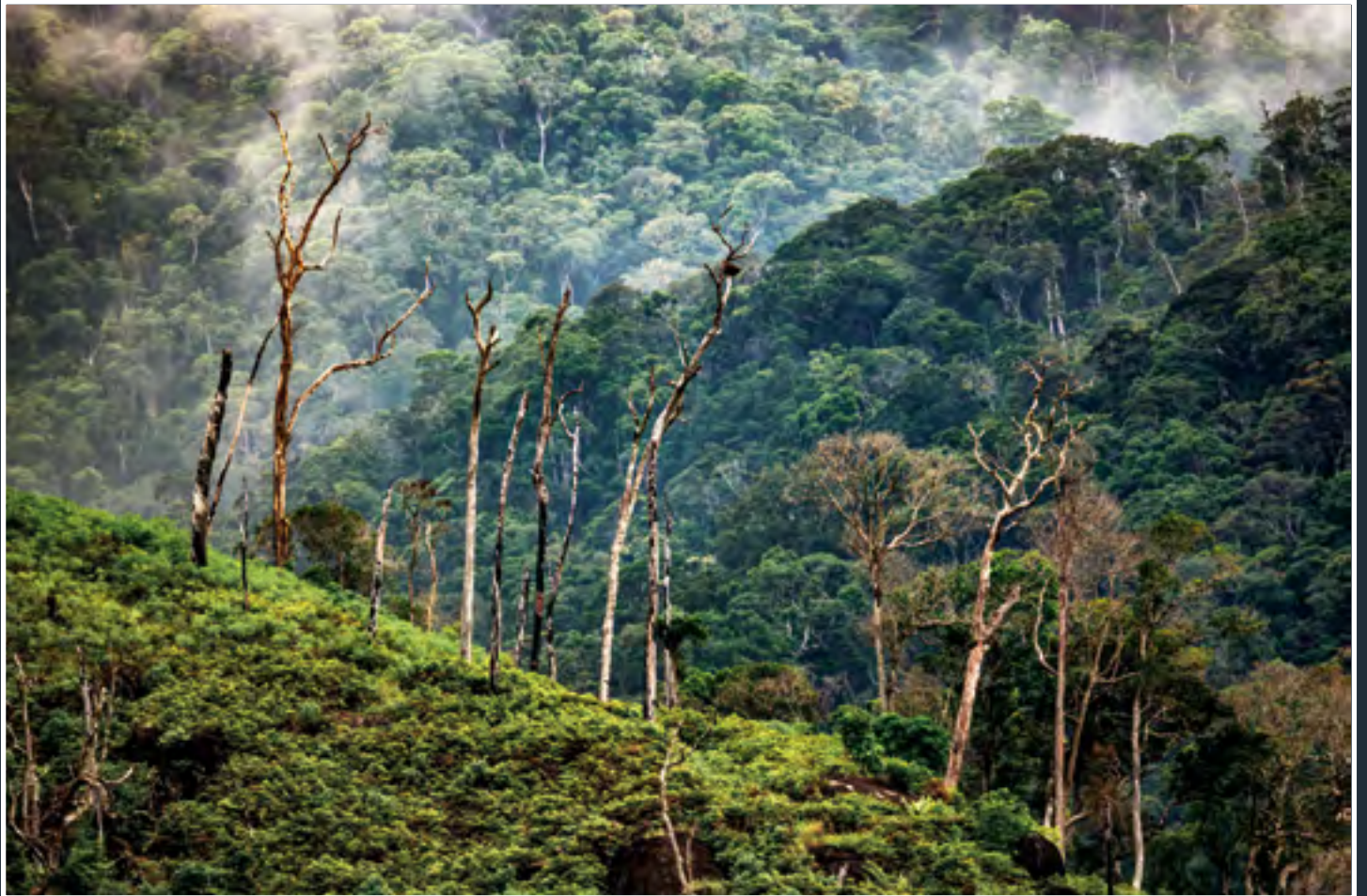
La luxuriante forêt d'Enekara fait partie de la zone protégée de Tsitongambarika