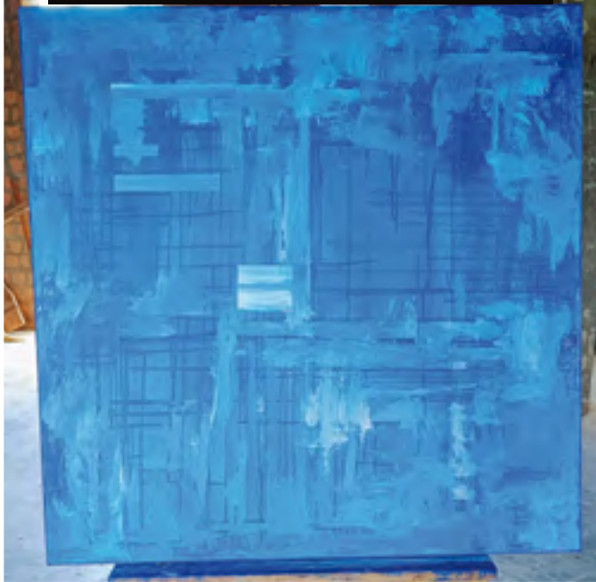
Des larmes qui se tissent, Acrylique sur toile, 2024, 100 cm x 100 cm

Cette couverture du magazine s'intitule « Partageons le monde » sur le thème de l'ODD 10 (Objectif de Développement Durable) sur la réduction de l'inégalité. Pour moi, cela commence par le respect mutuel à travers des carrés de diverses couleurs et de textures qui représentent un foyer, une communauté, une société voire un pays. Chaque carré est espacé d'une distance égale, et c'est cette distance-là qui signifie le respect. Cette œuvre a été réalisée dans le cadre de SDGs Through Art, un collectif de 17 artistes malgaches sous l'initiative de ZeeArts fondée par Zaahirah Muthy.